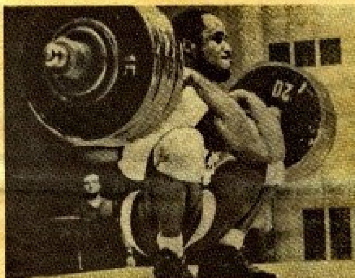
Луи Мартин (Англия) — неоднократный чемпион мира в полутяжелом весе