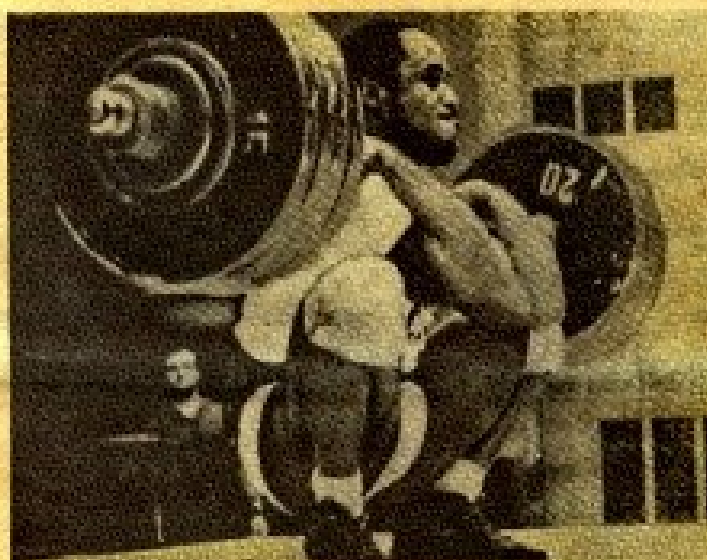
Луи Мартин (Англия) — неоднократный чемпион мира в полутяжелом весе